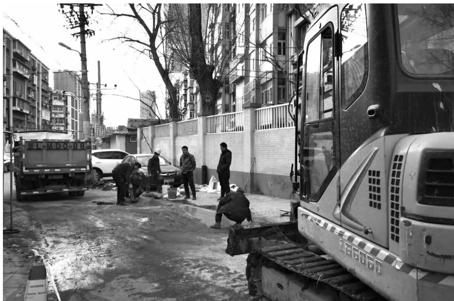
历时九个小时,工作人员路面基本修理完成。