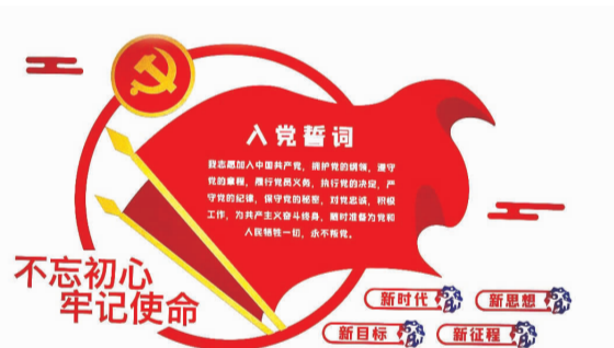
政协党支部将入党誓词张贴在墙上