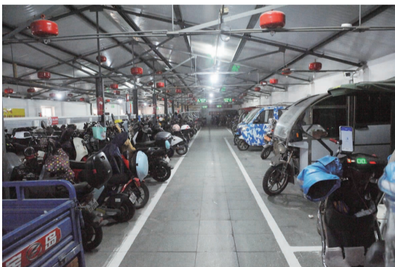
垂西社区8号楼前建设的停车棚

据了解,此车棚除了有专职人员24小时看守之外,为了充分做好安全防护工作,在进门前,需要先通过人脸识别系统;进入之后,有洗手液、消毒酒精、口罩等一应防疫物品。消防方面,内部安装有烟雾报警器、消防喷淋、监控探头等,此外,整个区域还规划有消防通道等,车棚内部的大彩电也反复播放消防安全宣传片,给安全加上多重保险。