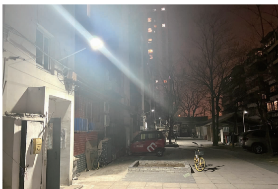
光华西小区安装路灯后夜间出行无障碍